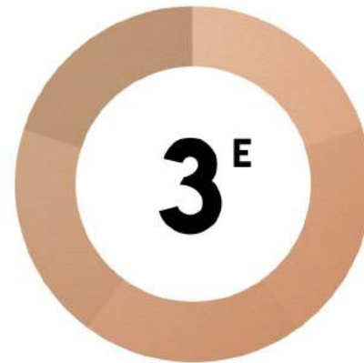
Compétition Académique Génie Chimique