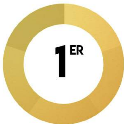
Compétition de la Machine

Voici les résultats de la délégation lors de la dernière édition des Jeux de Génie. Les délégués investissent beaucoup de temps et d'efforts pour parvenir à se démarquer lors des compétitions. Les nombreuses heures investies ont d'ailleurs porté fruit pour l'équipe de la compétition de la Machine, puisqu'elle a réussi à monter sur la plus haute marche du podium. Les efforts des déléguées ont permis d'avoir la quatrième place au classement général.