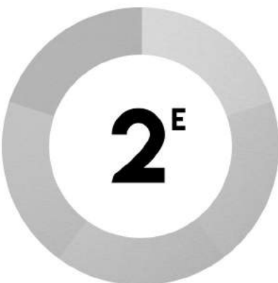
Esprit des Jeux