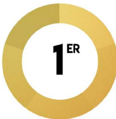
Compétition Académique Génie Électrique